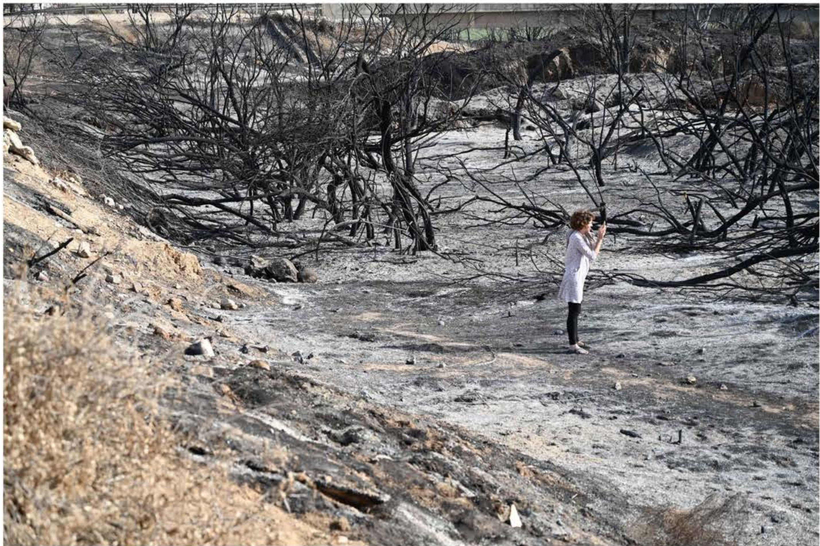
דנה אריאלי, חות אל היען , 2021 מתוך הסדרה "צלקות פחם/הפנטום הציוני". חברת סגל ביחידת בוגרות ובוגרי מנדל