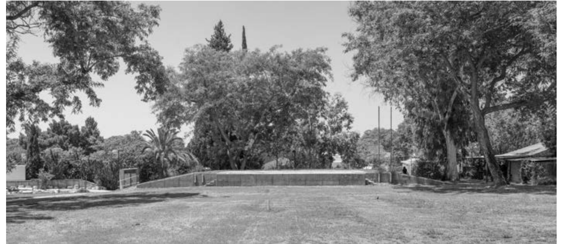
עמרי קרן-לפידות, בימת תרבות, בארי , מתוך הסדרה "נחלת הכלל", 2020