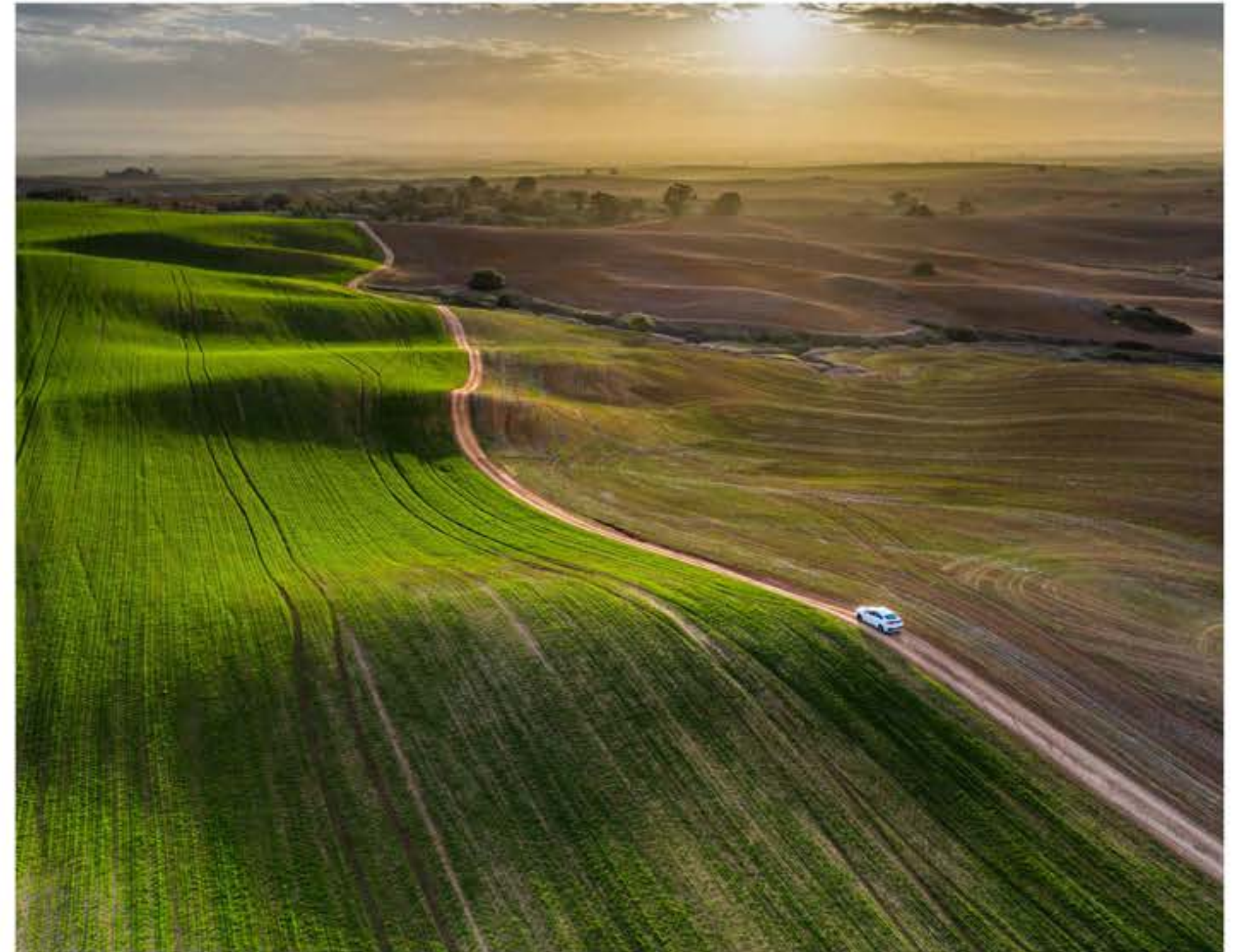
אור אדר צילום רחפנים, כניש משובש, 2020