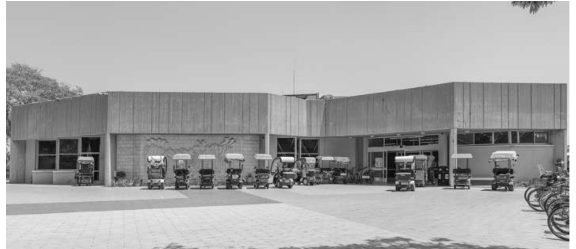
עמרי קרן-לפידות, חדר אוכל, בארי , מתוך הסדרה "נחלת הכלל", 2020. בוגר תוכנית מנדל למנהיגות תרבות בנגב, מחזור ב'