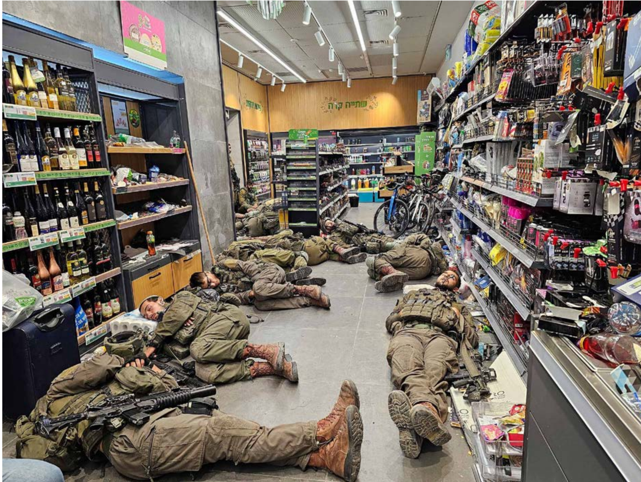
בתיאור הולין, מנוחת הלוחמים, 7.10.2023 (ביציאה מקיבוץ כפר עזה)